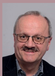
DI Fritz Trimmel , ehemaliger Landesbediensteter und ehemaliger Bürgermeister von Krumbach.