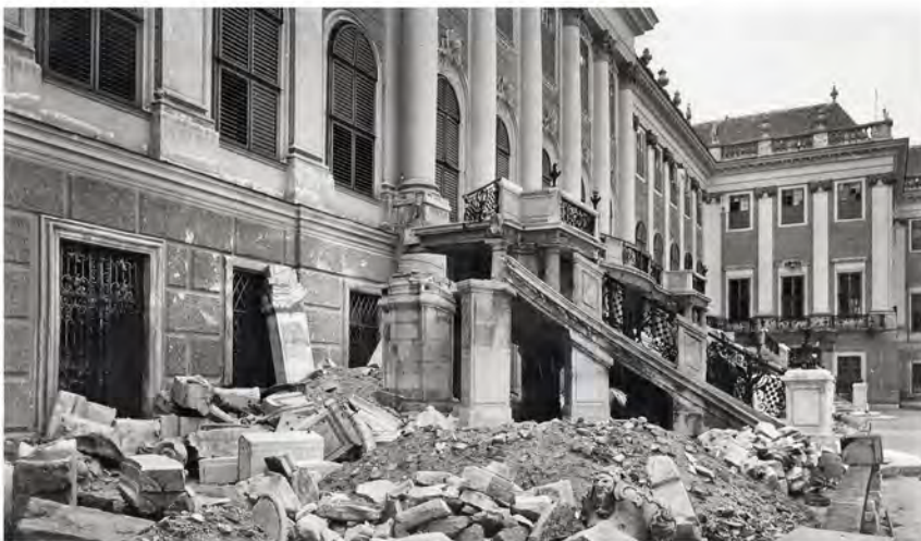
482-483 | Kriegszerstörungen am Kavalier- und Hofküchen- trakt (unten links) und Palmenhaus (unten rechts), 1945 (Inv.Nr. 52555)