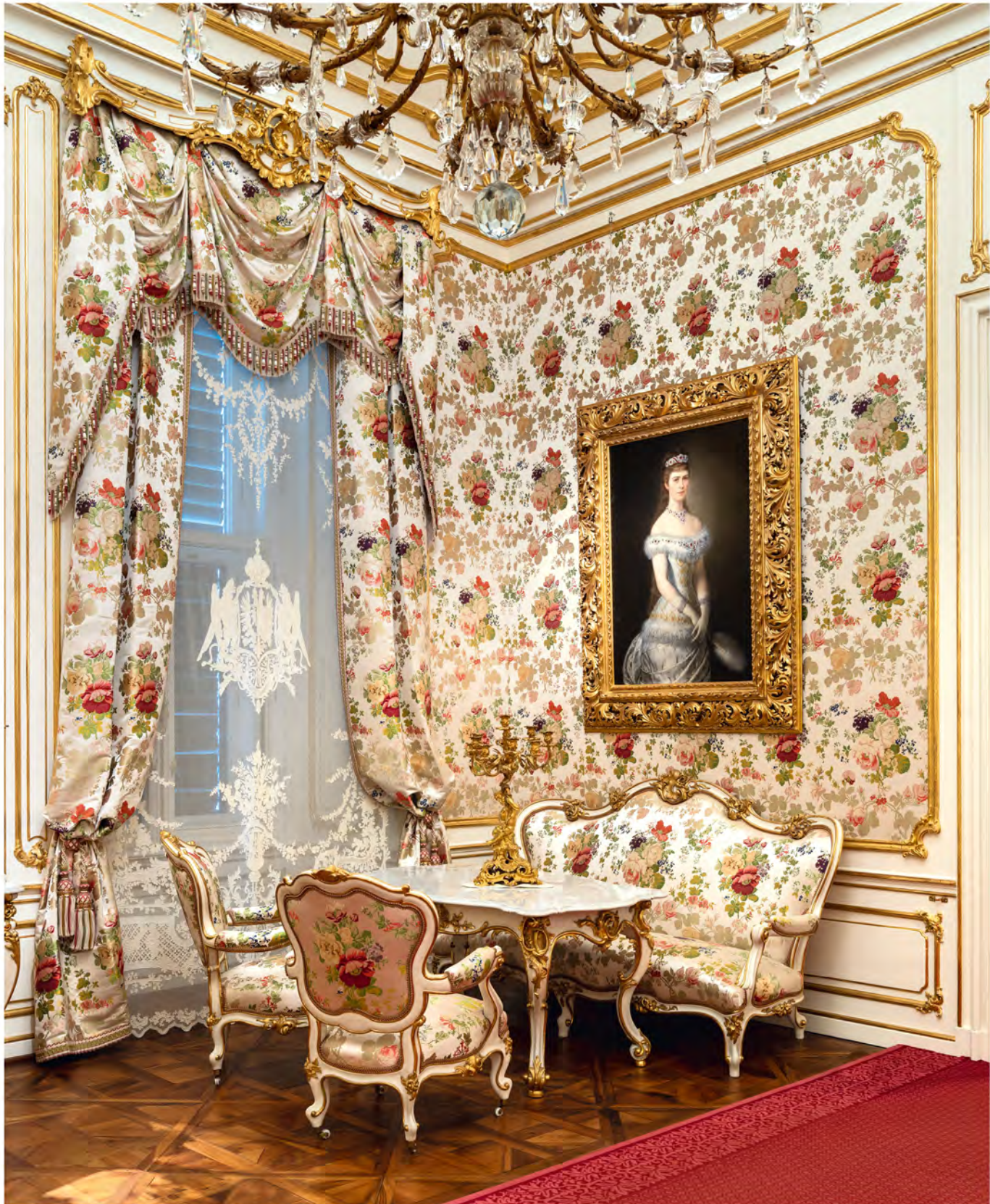
433 | Salon der Kaiserin mit dem Porträt Elisabeths von Hans Skallitzky als Ersatz für den ehemaligen Bilderschmuck