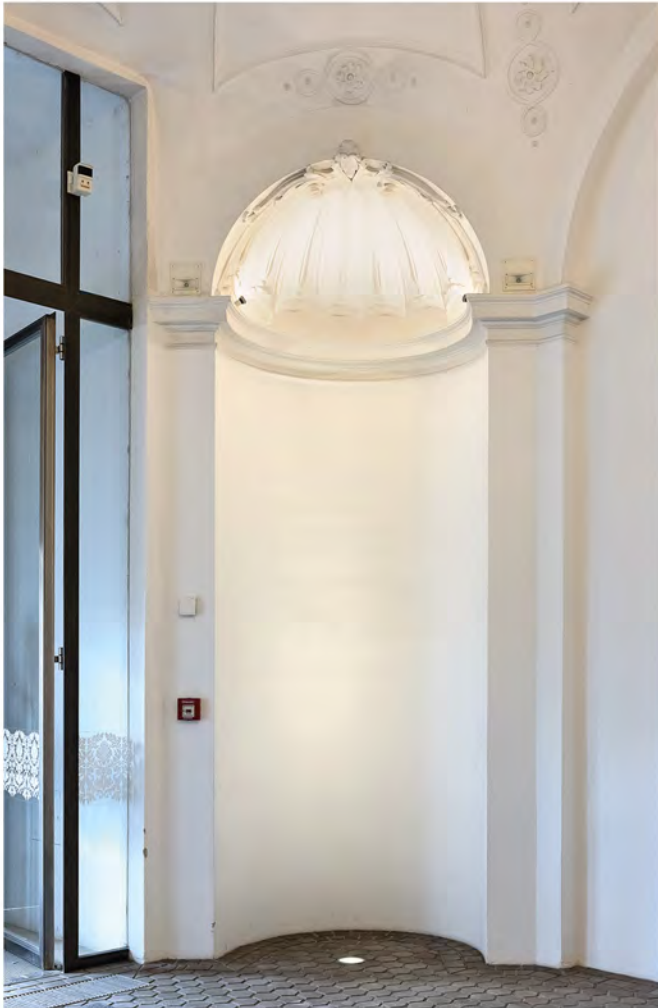
83 a | Westflügel, Vestibül