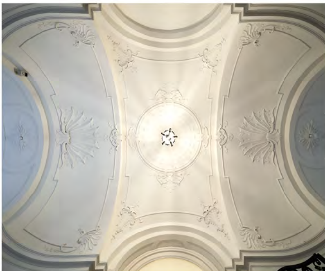
83 d | Westflügel, Deckengewölbe