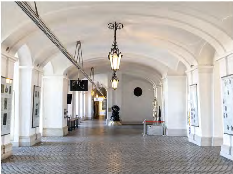
73 a-b | Mittelvestibül, Blick zum Ostflügel (oben), Detail Gewölbegliederung (unten)